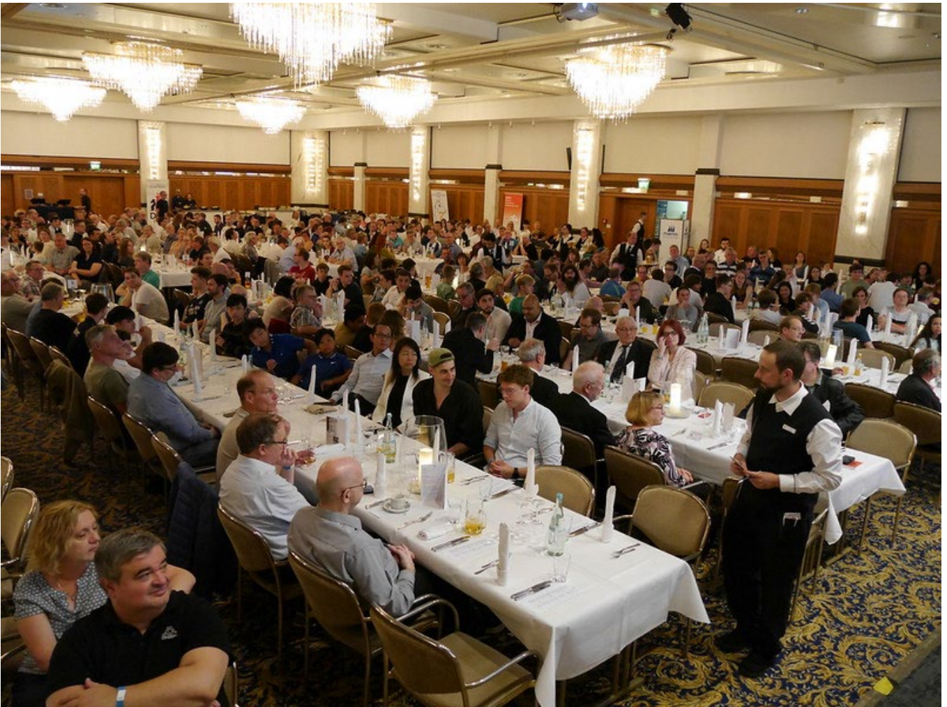
gut besuchte Abschlussveranstaltung