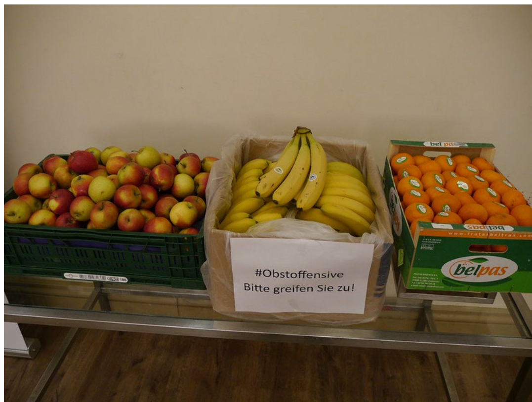
Obstoffensive in Düsseldorf

Die Saison 2022/2023 war hinsichtlich der Teilnehmerzahl die erfolgreichste in der über 20-jährigen Geschichte des Turniers