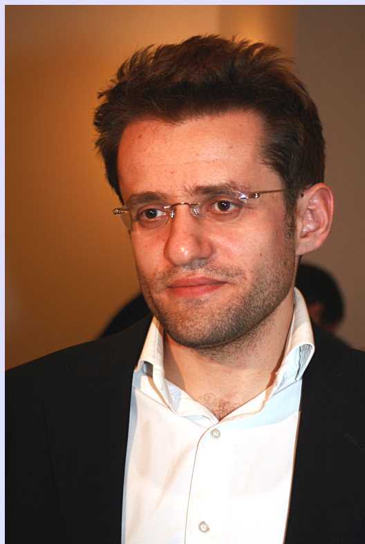
Levon Aronjan Nr. 2 der Weltrangliste, Elo 2813