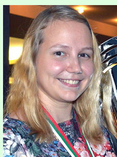
Walentina Gunina (Russland)