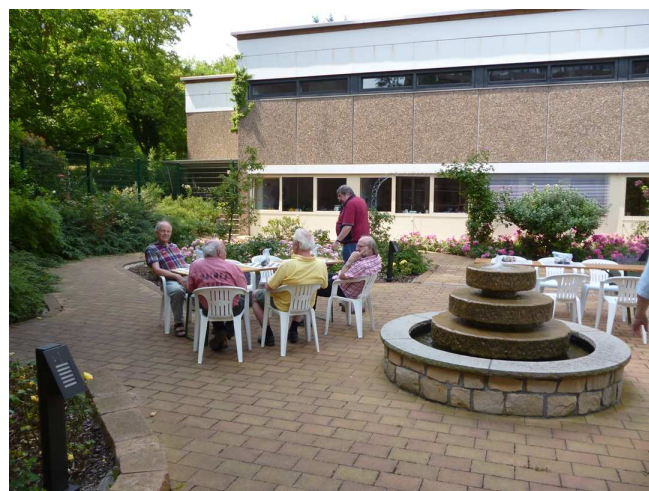
Der Innenhof – gleich neben dem Turniersaal – lädt zum Verweilen ein

Nähere Informationen erhalten Sie auch von der Tourist Information Neustadt an der Weinstraße Tel.: 06321/926892 • www.neustadt.eu